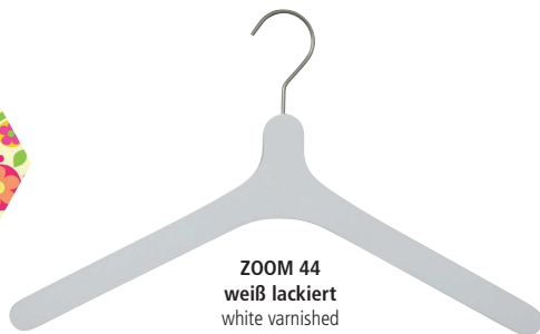
ZOOM 44 weiß lackiert white varnished

Artikelnummer / item number: 58800 03 000