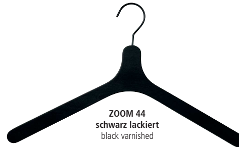
ZOOM 44 schwarz lackiert black varnished

Artikelnummer / item number: 58800 53 000