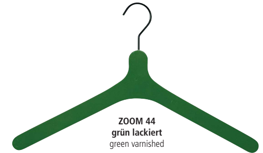
ZOOM 44 grün lackiert green varnished

Artikelnummer / item number: 58800 05 000