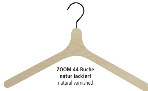
ZOOM 44 Buche natur lackiert natural varnished

The ZOOM series of hangers are perfectly designed, very strong, feel good in the hand, and carry all kinds of upper garments and even heavy coats with ease.